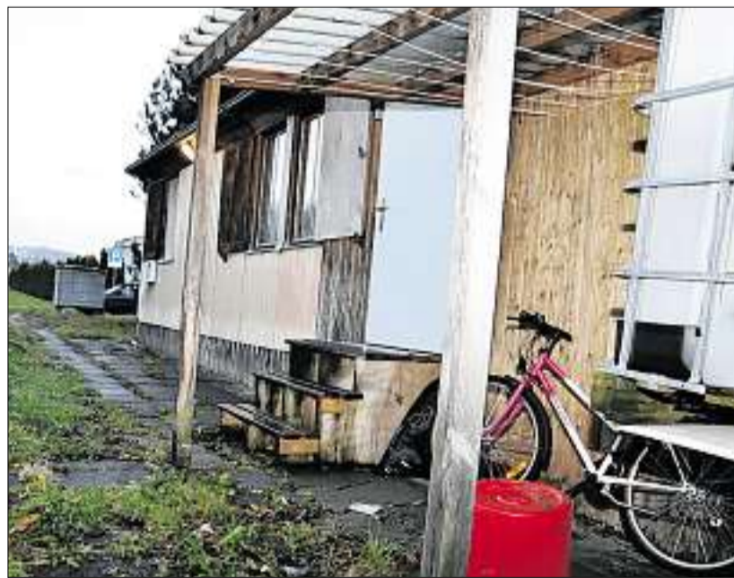
In dieser Baracke soll niemand mehr hausen müssen. Die Gemeinde ersetzt sie durch drei Wohncontainer. (ct)

Weiter befinden die Stimmberechtigten über den Voranschlag 2010 der Politischen Gemeinde. Das 17,7-Millionen-